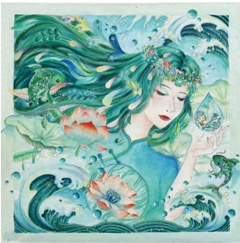
《浅色夏末》装饰画 学生：陈璐 指导教师：齐潇