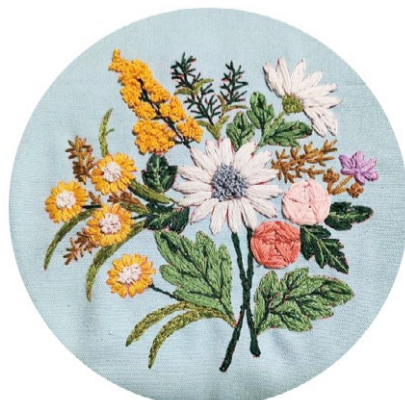
《花团锦簇》鲁绣 学生：陆佳怡 指导教师：张欣