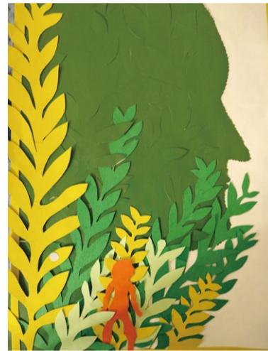
《拼贴艺术》装饰画 学生：郑旭 指导教师：刘亚楠