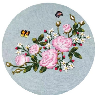
《蝶舞》鲁绣 学生：孙瑜晓 指导教师：张欣