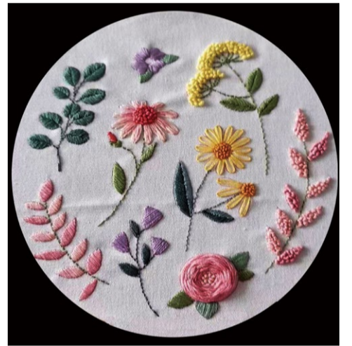
《春天》刺绣 学生：尚雯雯 指导教师：石向飞