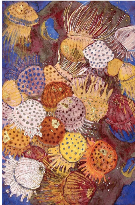
《海底之观》岩彩画 教师：刘亚楠