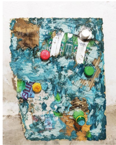
《海泣》装饰画 学生：韩爽 指导教师：景婷婷