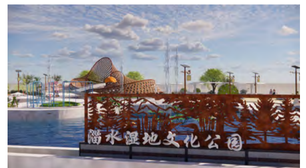
乡村振兴类规划设计《泱泱齐都 淄水》 学生：冯麒麟 指导老师：朱博