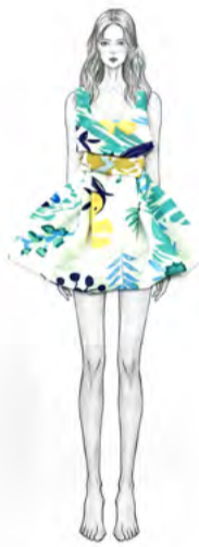
服装设计 学生：付莉莉 指导老师：杜康