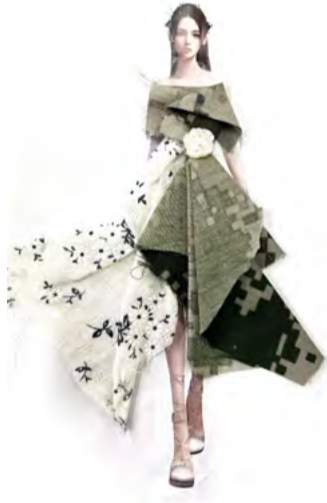
服装设计 学生：冀怀福 指导老师：杜康