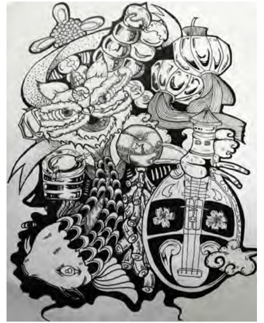
装饰画 学生：王静静 指导老师：吕良