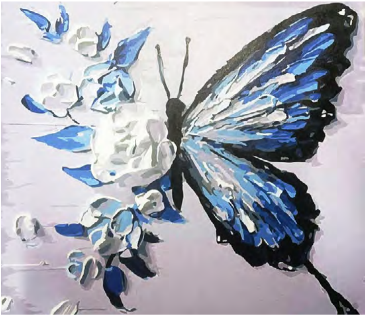
装饰画 学生：程梦柯 指导老师：吕良