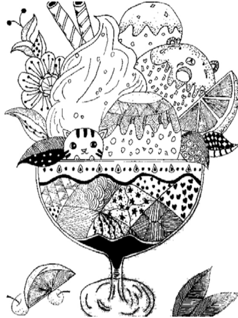
装饰画 学生：李绪琦 指导老师：吕良