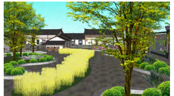
乡村振兴类规划设计《聚才振兴“一池春水”博山区乡村振兴广场设计》 学生：刘金慧 指导老师：朱博