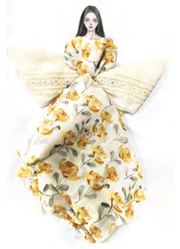
服装设计 学生：于晴晴 指导老师：杜康